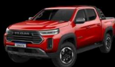
ROJO FURY Exclusivo para Warlock