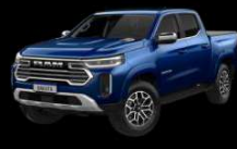
AZUL TEMPEST Exclusivo para Laramie