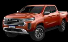
CAFÉ TERRA SUNRISE Exclusivo para Laramie