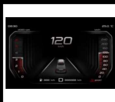
CONTROL CRUCERO ADAPTATIVO