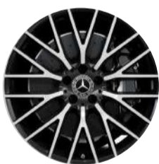
Llantas S 450 4MATIC