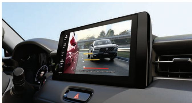
LaneWatch™ - Asistente de punto ciego

Además, el HSA® (Hill Start Assist) facilita los arranques en pendientes al mantener el freno activado durante unos segundos, evitando retrocesos. En el día a día, el Brake Hold aporta practicidad en el tráfico: mantiene el vehículo detenido de forma automática, incluso en inclinaciones, hasta que presiones el acelerador. Así, cada trayecto con el Nuevo Honda HR-V se convierte en una experiencia más tranquila, segura y eficiente.