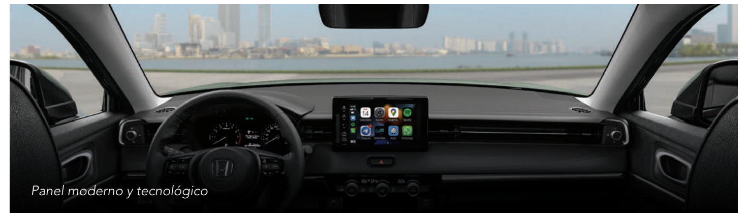
Panel moderno y tecnológico