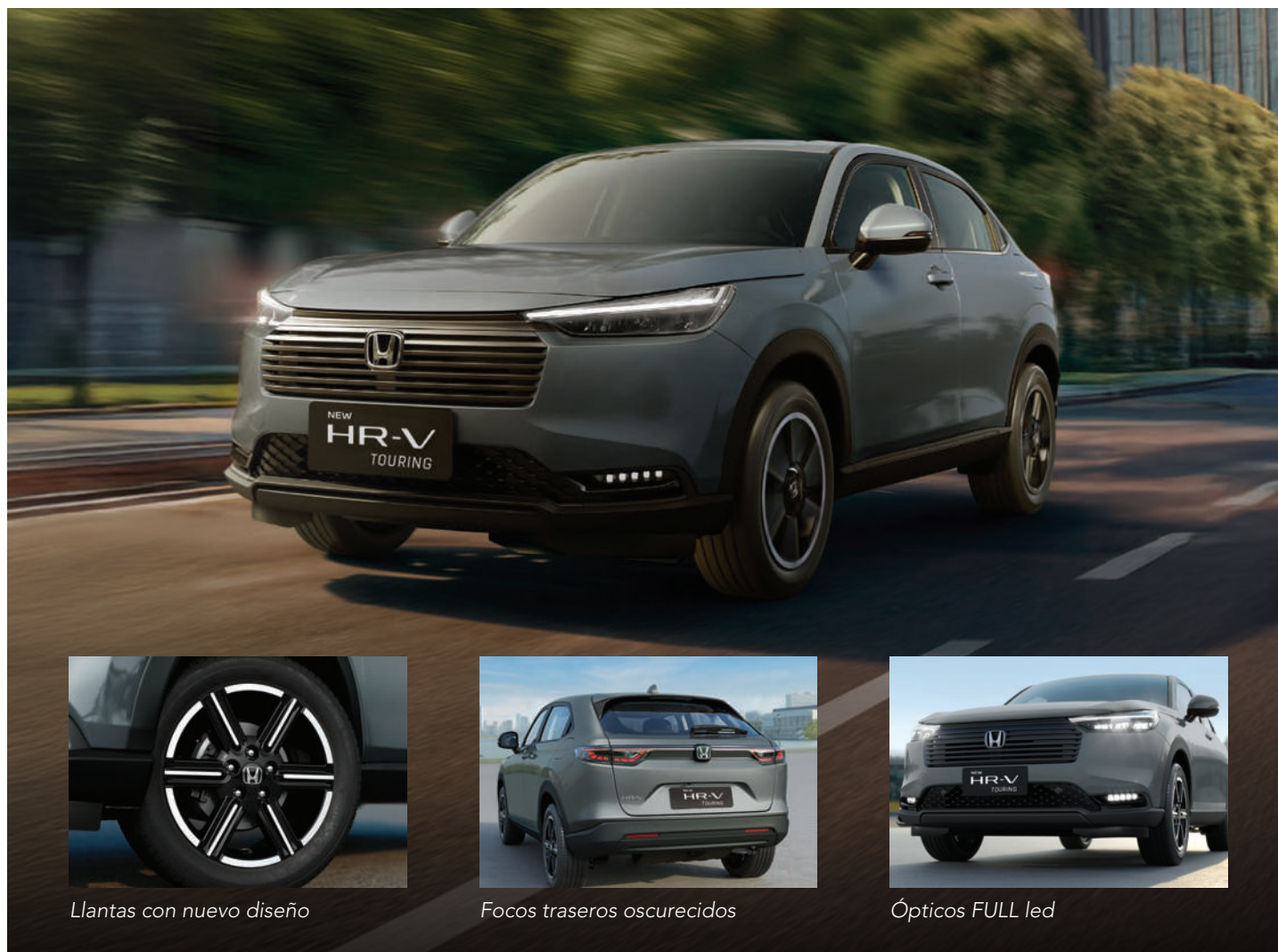
Llantas con nuevo diseño