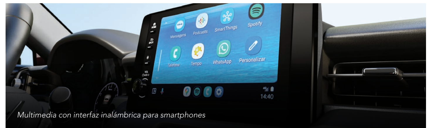
Multimedia con interfaz inalámbrica para smartphones