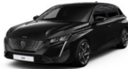
Perla Nera Black