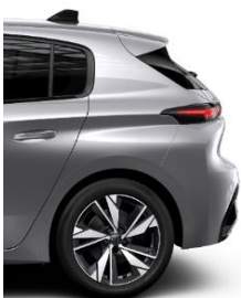
Allure MT6 17" Alloy Calgary