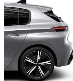
GT 18" Alloy Kamakura