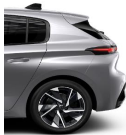
Allure EAT8 17" Alloy Halong