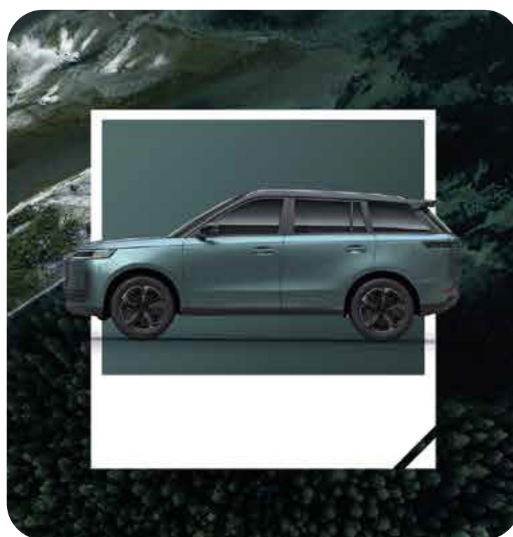
Verde / Techo Negro