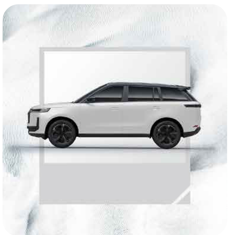
Blanco / Techo Negro