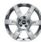
18" Llantas Asteroid Spoke