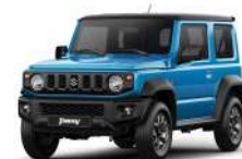
Azul Techo Negro