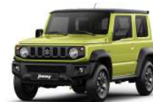
Verde Lima Techo Negro