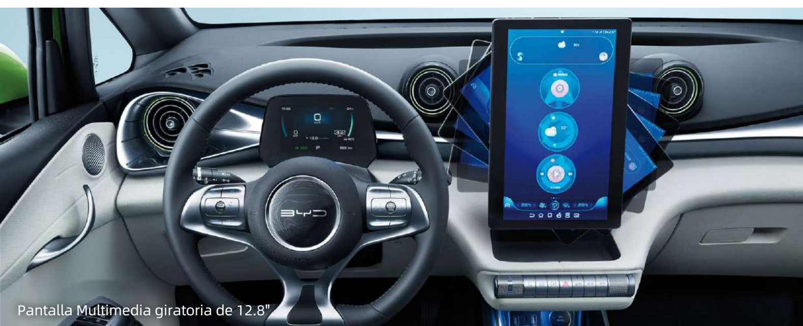
Pantalla Multimedia giratoria de 12.8"