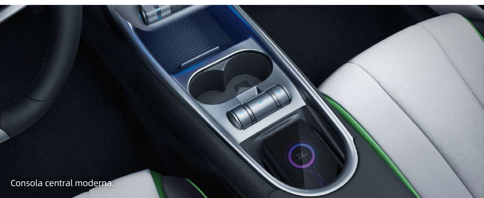
Consola central moderna.