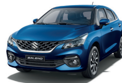
Azul Metálico Perlado