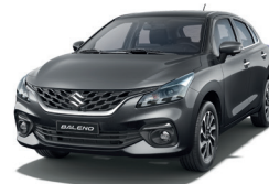
Gris Metálico Perlado