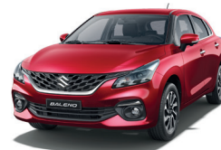
Rojo Metálico Perlado