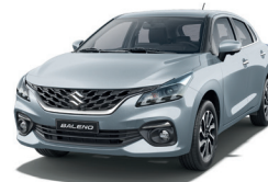
Plata Metálico Perlado