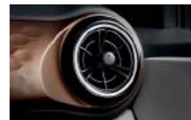
Ventilaciones de AC únicas estilo de hélice