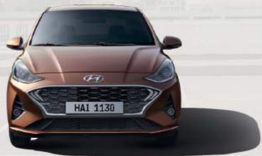
Diseño delantero / Parrilla hiper plateada

Hay mucho por hacer y el Grand i10 te ayuda a hacerlo con estilo. Es joven, deportivo y te enamorarás de él a primera vista. Se ve muy bien en el acabado básico, pero tienes la libertad de darle un toque de vida con un montón de opciones disponibles, como llantas de aleación de 15 pulgadas, iluminación LED exterior mejorada y mucho más.