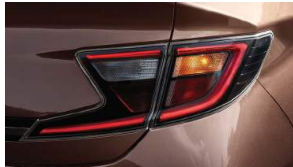
Luces combinadas traseras envolventes