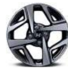
Llantas de aleación de 15"