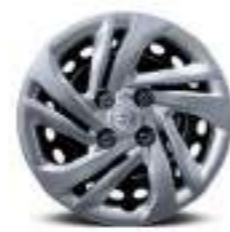
Llantas de acero de 14"