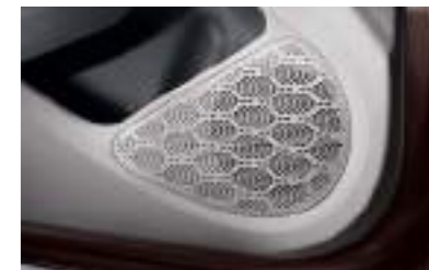
Sistema de cuatro parlantes delanteros / traseros