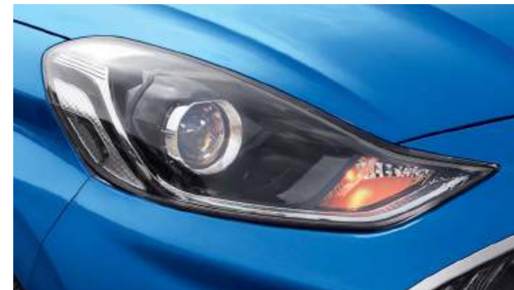
Faros delanteros de proyección