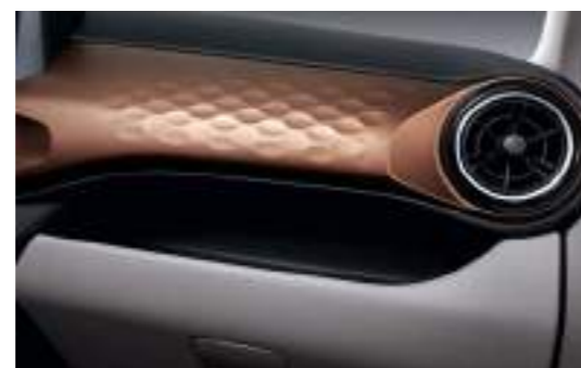
Paño + Vinilo Opcional