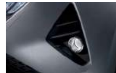
Delantera Luces antiniebla