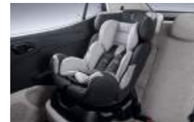
Sistema de anclaje para asientos infantiles ISOFIX