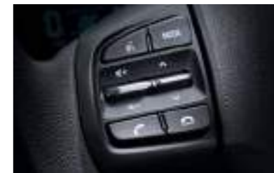
Bluetooth manos libres