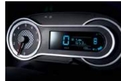
Tablero de supervisión