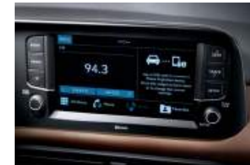
Pantalla táctil de 8"