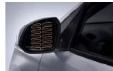
Espejos laterales calefacción