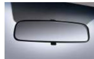
Espejo retrovisor día-noche