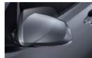
Espejos eléctricos plegables