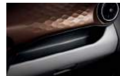
Área de almacenamiento práctica