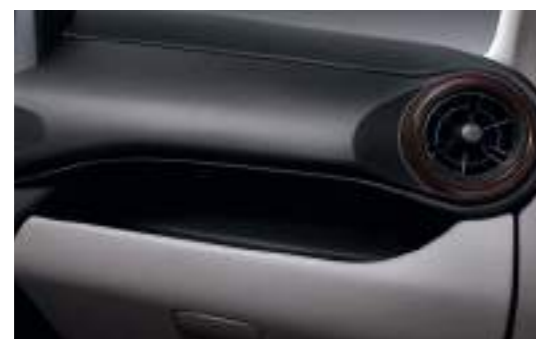
Paño + Vinilo Estándar