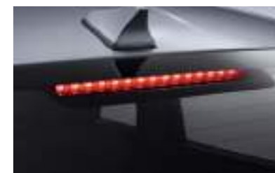
Faro de freno alto