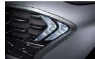
Luces para circulación diurna(DRL) LED