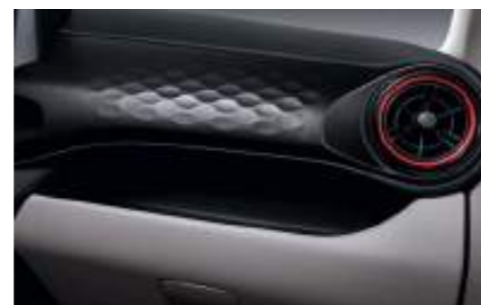
Paño + Cuero artificial - Rojo