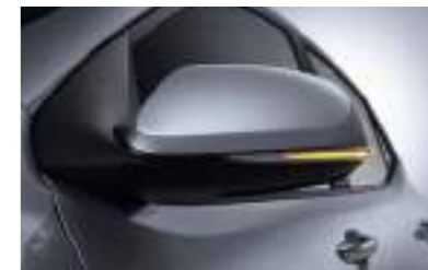
Espejos y repetidores exteriores