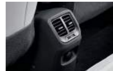
Ventilación de AC en la parte trasera