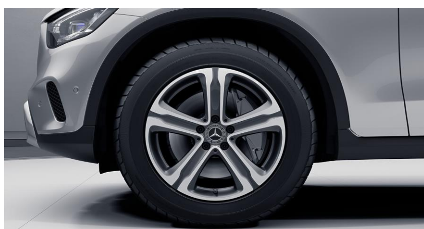
Llantas de aleación de 18" y 5 radios, color gris tremolita y pulidas a alto brillo