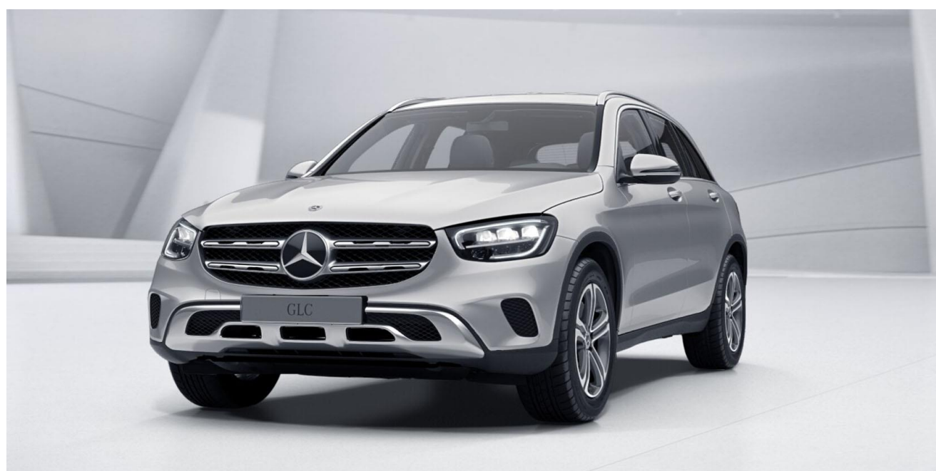
Línea exterior Off-Road