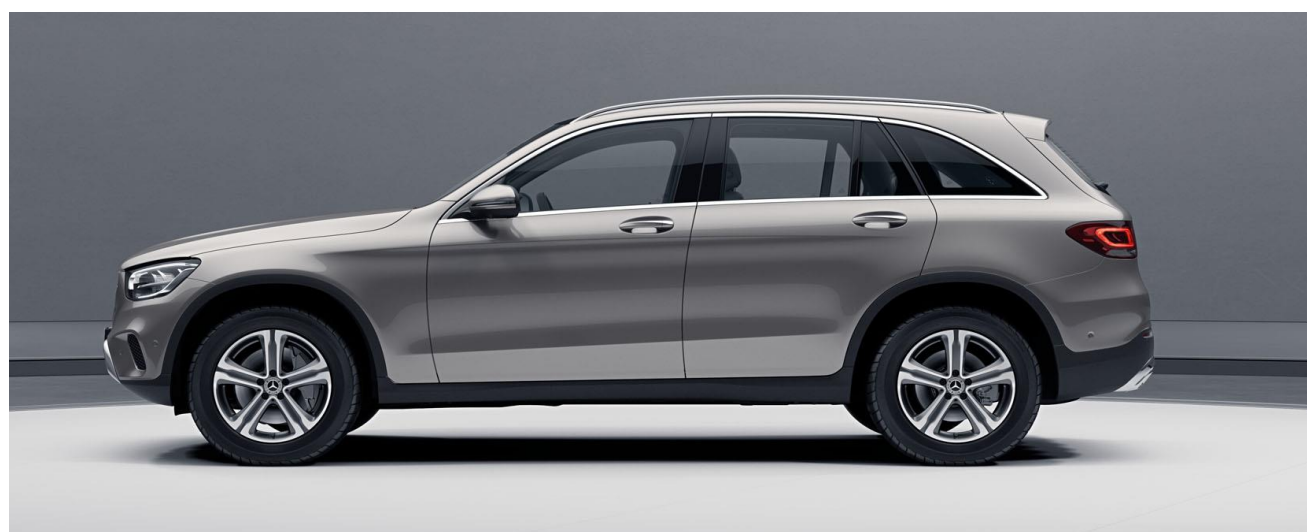
Línea exterior de Off-Road