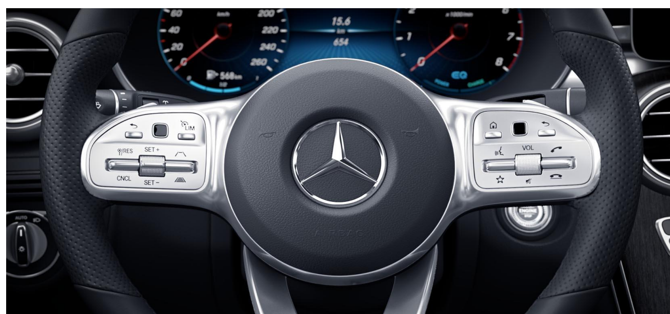
Nuevo volante deportivo multifunción.

No tienes más que decir <<Hey Mercedes>> para que tu MBUX atienda tus peticiones.