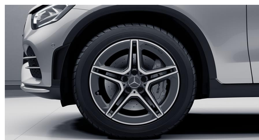
Llantas de aleación AMG de 19" y 5 radios, color gris tremolita y pulidas a alto brillo