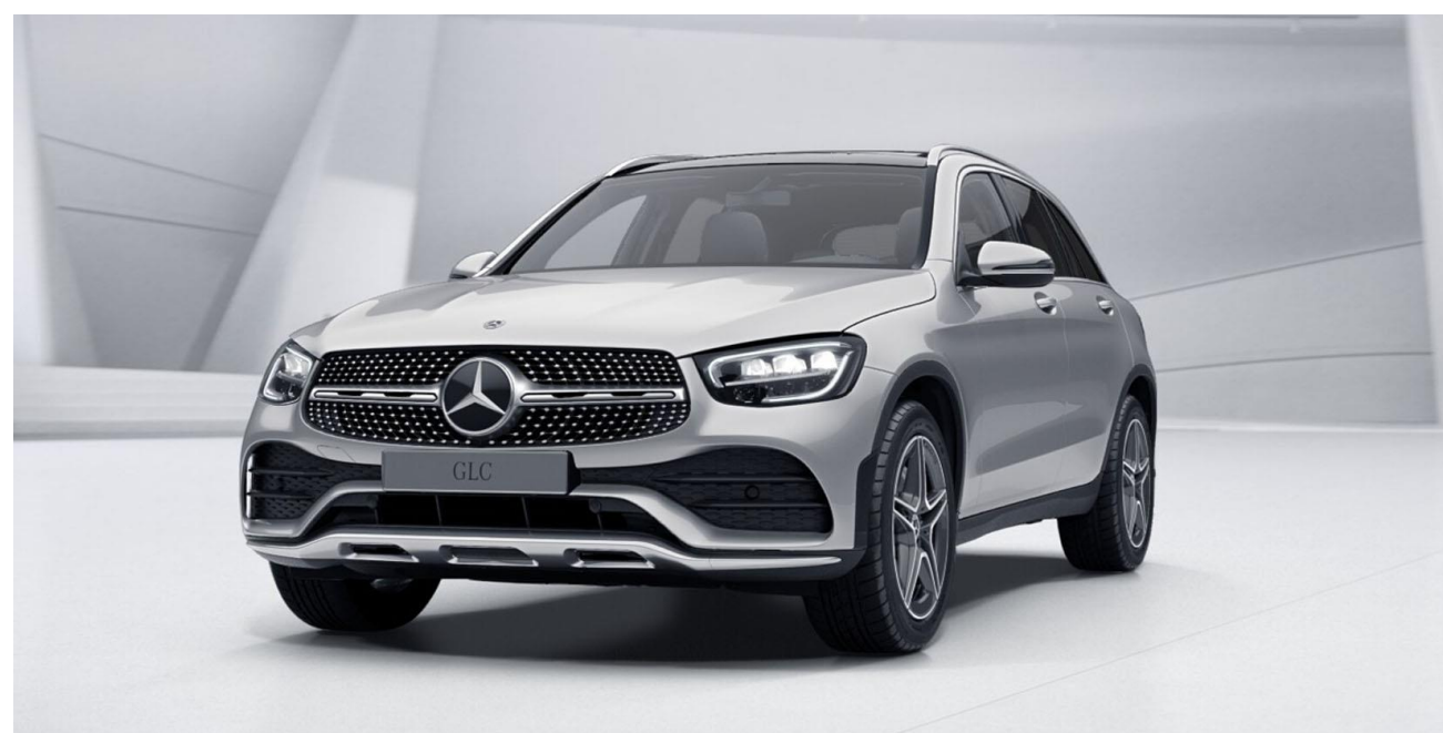
Línea exterior AMG