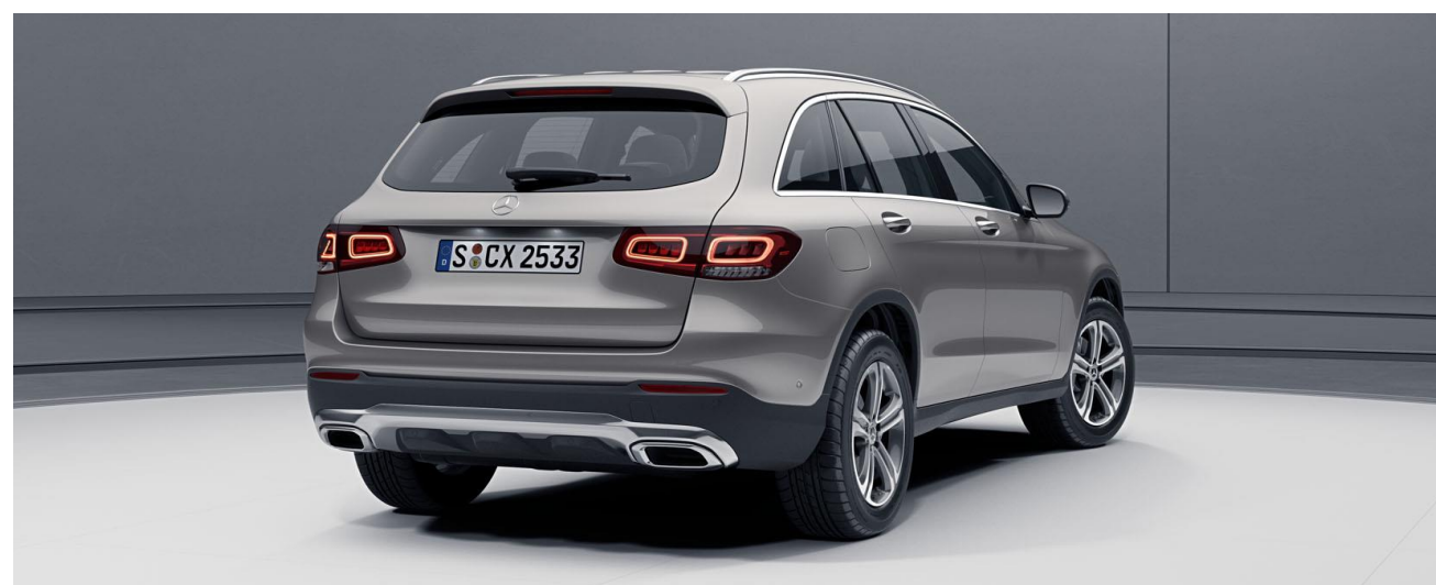
Línea exterior Off-Road *GLC 220 d 4Matic