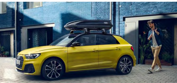
Barras de techo y Portaequipaje