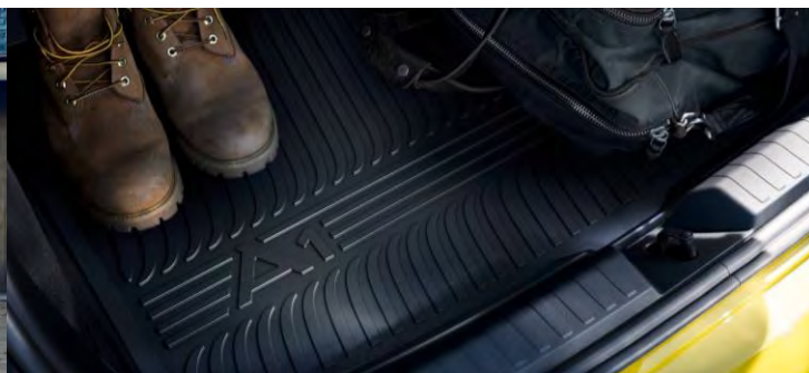
Pisos de goma y protección maletero