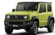
Verde khaki techo negro