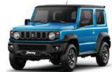
Azul techo negro