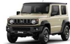
Marfil techo negro