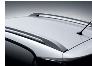
Marco del techo pintado en plata