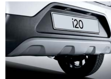
Placa protectora trasera