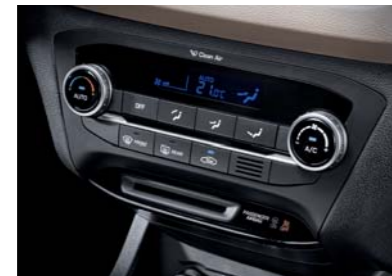
Sistema de aire acondicionado totalmente automático