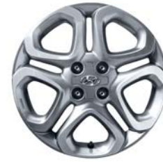
Llantas de aleación de 16"