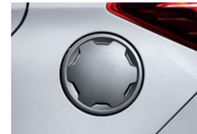
Tapa del tanque pintada en plata