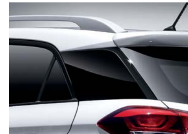
Detalles exteriores en negro piano