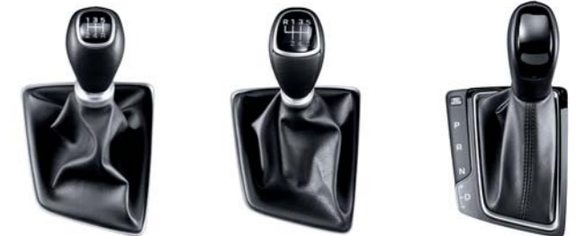
Transmisión manual de 5 velocidades

Debido a que los requisitos de potencia varían de un conductor a otro, Hyundai ofrece una selección de motores y transmisiones para el nuevo i20. Los motores Kappa del i20 adoptan una inyección multipunto probada y verdadera para garantizar un ahorro de combustible óptimo. El diseño 5 puertas viene con Kappa de 1.2L acoplado a una transmisión manual de 5 velocidades, mientras que el Active Edition tiene 1.4L y transmisión manual de 6 velocidades. La transmisión automática de cuatro velocidades es una opción disponible en ambos modelos y niveles de equipamiento. Para los aficionados del diesel, el 1.4L U2 ofrece una excelente economía.