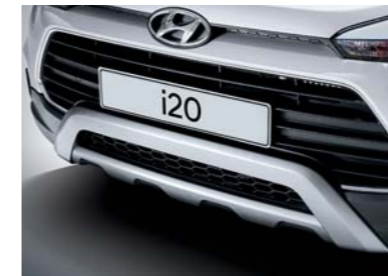
Placa protectora delantera