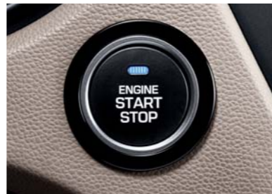
Botón de Encendido/Apagado del motor