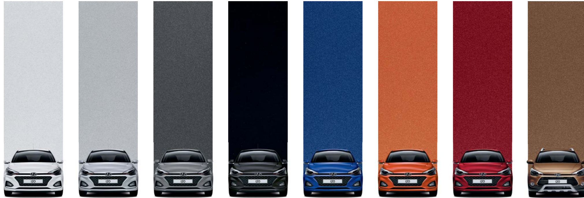
Blanco polar PSW