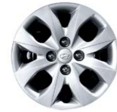
Tazas de 14"