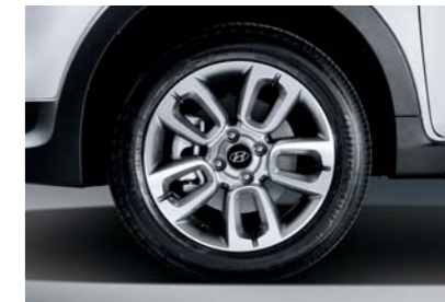
Llantas de aleación de aluminio