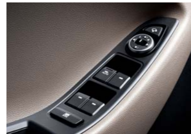
Controles eléctricos para las ventanillas