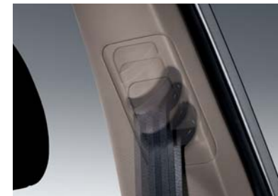
Cinturones de seguridad