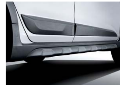
Molduras y revestimientos laterales