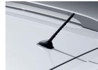
Antena de techo