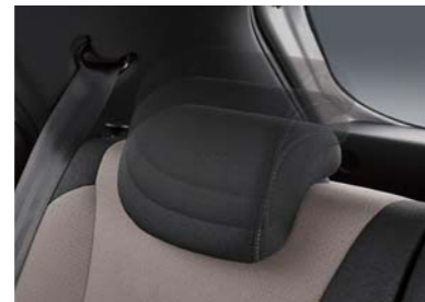
Apoyacabezas en los asientos traseros