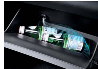
Enfriador en la guantera