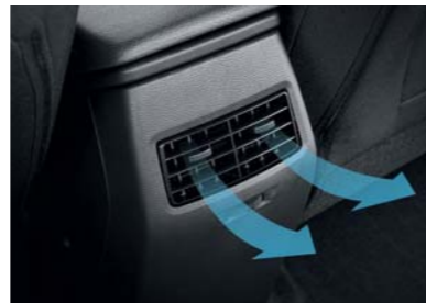
Ventilación en la parte trasera