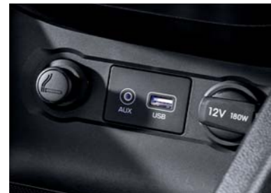
Conectividad (AUX, USB)