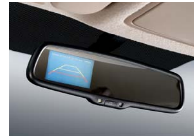
Sistema de pantalla para la cámara posterior (RCD)