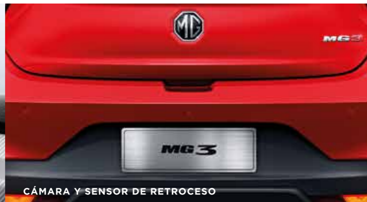
CÁMARA Y SENSOR DE RETROCESO