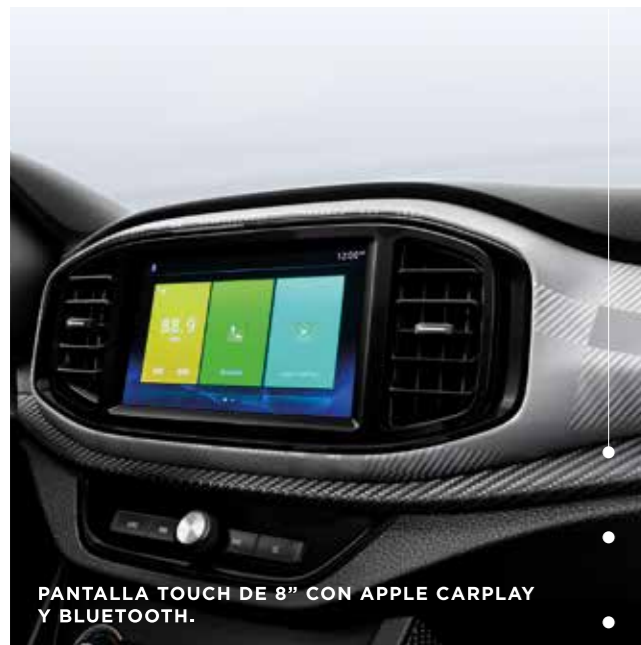
PANTALLA TOUCH DE 8" CON APPLE CARPLAY Y BLUETOOTH.