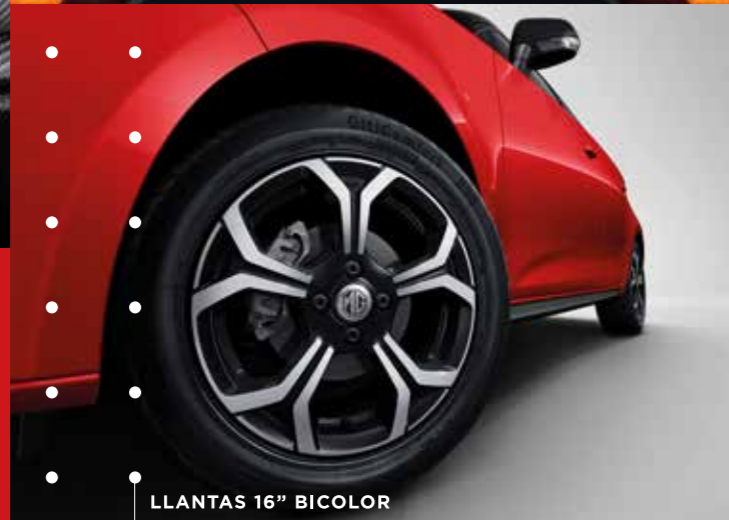
LLANTAS 16" BICOLOR