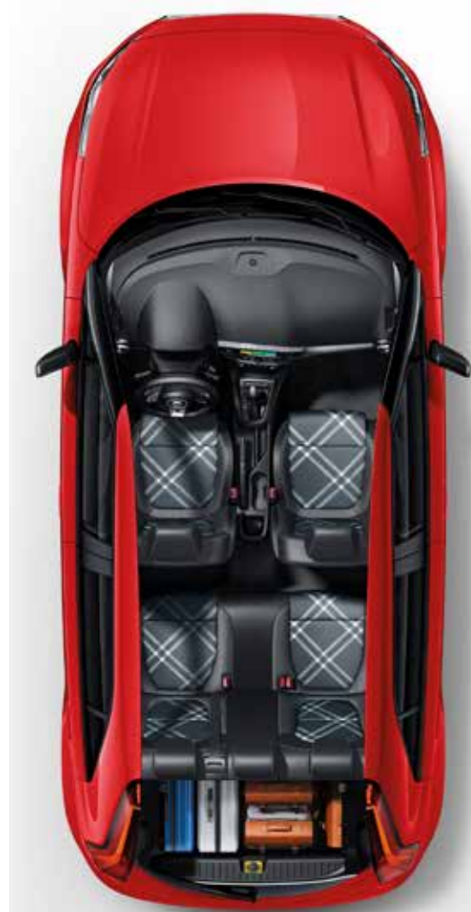
AMPLIO ESPACIO INTERIOR